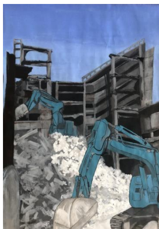
【令和5年度最優秀作品】