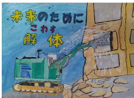
【令和5年度最優秀作品】