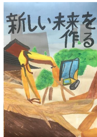
【令和5年度佳作作品】