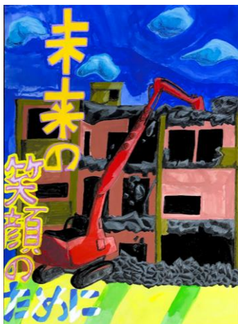
【令和2年度最優秀作品】